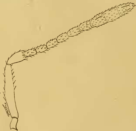
Fig. 2.ª — Antena de Schedioides formosus ♀ (muy aumentada).

de éste, todos más largos que anchos. Mesonoto entero, sin surcos parapsidales; axilas contiguas en el ápice; escudete convexo, triangular. Nervio submarginal de las alas anteriores, notablemente engrosado e incurvado en el último tercio de su longitud; nervio marginal grueso, puntiforme; nervio estigmático más largo que el posmarginal; línea calva completa. Patas normales; espolón de las tibia intermedias, tan largo como el metatarso; tibia posteriores